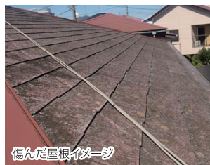
傷んだ屋根イメージ