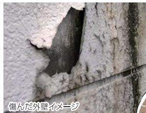
傷んだ外壁イメージ

傷んだ屋根や外壁を放っておくと、見栄えが良くないだけでなく、雨漏りや雨染みへの耐性がなくなり防水効果が弱まってしまいます。屋根、外壁を修繕せずにそのままにしてしまうことで、破損部やキズが内部まで浸透し、状態が悪化してしまうのです。